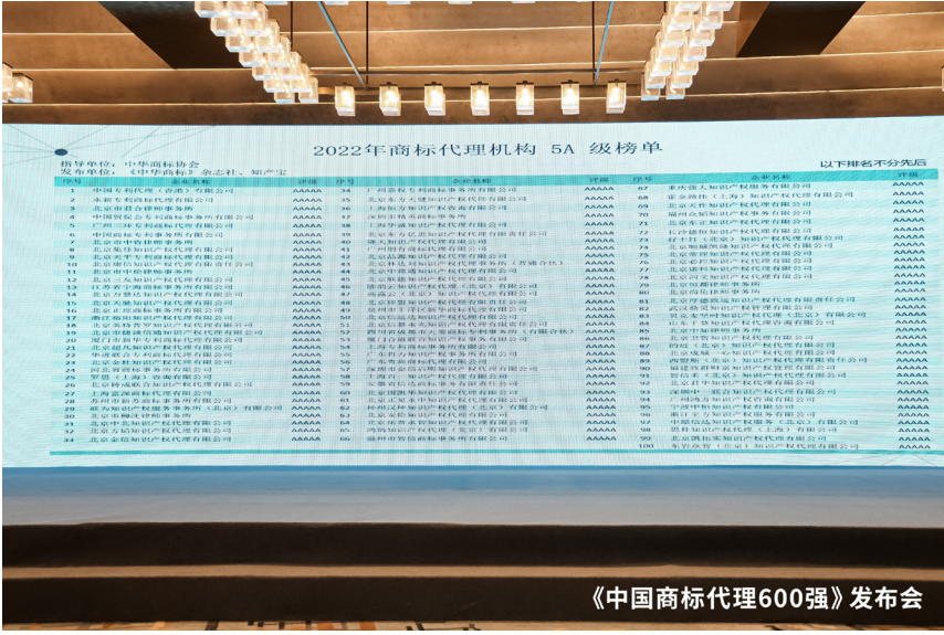
《中国商标代理600强》发布会