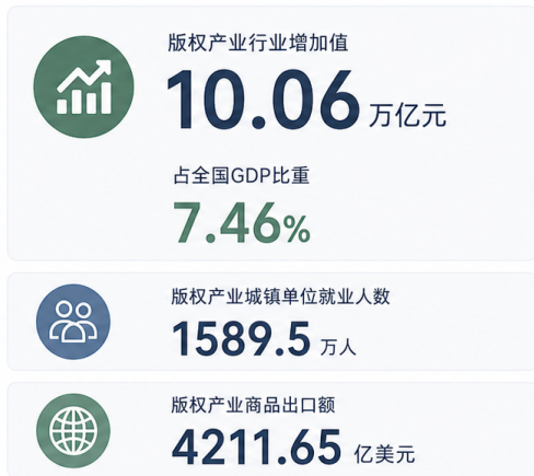
2019—2024年版权产业行业增加值 (万亿元)